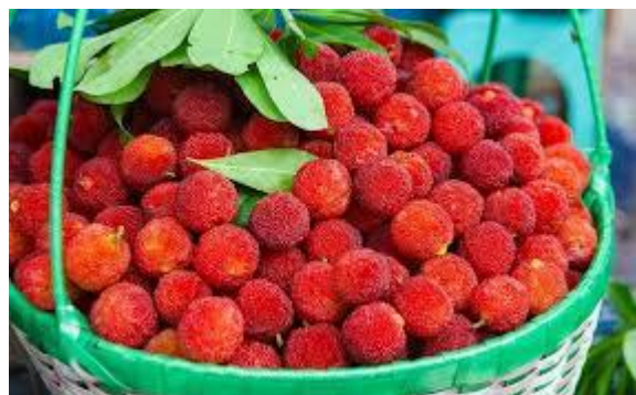
Il cestino omologato