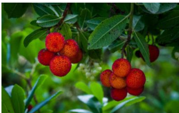
Il prelibato corbezzolo

È fatto tassativo divieto ai concorrenti di mangiare corbezzoli lungo il percorso. È tuttavia consentito raccoglierne (max 1 cestino a squadra, solo frutti maturi e sani) qualcuno da consegnarsi ai responsabili di gita ed agli addetti al percorso.