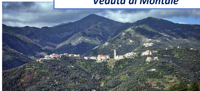
Veduta di Montale